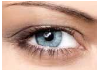
Χωρίς βλεφαρίδες extensions