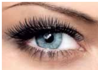
Με βλεφαρίδες extensions